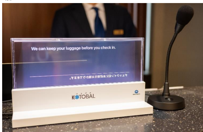
多言語通訳サービス「KOTOBAL」の利用イメージ